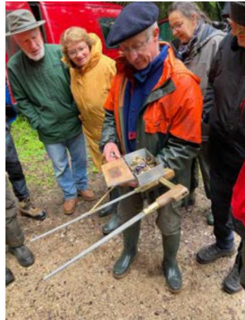
Compas enregistreur inventé et utilisé par l'un des membres historiques de la société du contrôle au début du XXème siècle.

Pour faire face à ces changements de température et de répartition de précipitation annuelle, les gestionnaires sont de plus en plus convaincus que les essences feuillues, qui ont toujours eu leur place dans une certaine mesure (10 à 15 %) devront être encore davantage favorisées à l'avenir et être considérées sans doute non plus comme simple auxiliaire de production mais aussi comme essence objectif pour certaines d'entre elles.